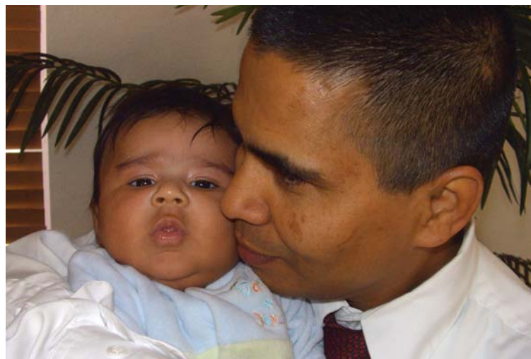
Crédito: Joy V. Browne, UCDHSC